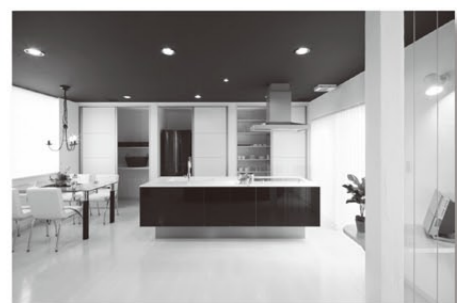
白い建具を開けるとパントリーと家電収納スペース。 急な来客にもパツと目隠しできます。