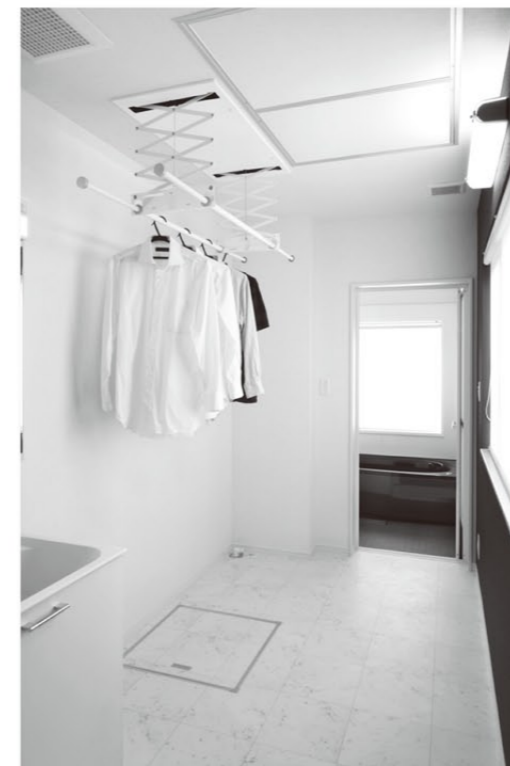
脱ぐ→洗う→干す→取込む→仕舞うがここだけでできる 洗面脱衣室。全館空調ゆえの人気アイテムです。

階段を上ると即そこが30帖のLDK。アイランド型に据えられたシステムキッチンの背後には、白い建具で仕切ったパントリーや厨房家電スペース。大きなサッシの向こう側は屋外ダイニングの広いバルコニー。真冬でも、LDKはもちろん、1階と2階の全空間が温度差のない、穏やかで快適な温度。それがどんなにライフスタイルを変えてくれるか、住んでみて改めて感動しています。大満足の理想的な住まいです。