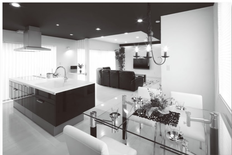
スタイリッシュで広いLDK(30帖)はいつも快適。

構造・・・木造2階建て 工法・・・完全外断熱(ネオマフォーム) 開口部・・・オール樹脂サッシ(Low-Eペアガラス) 1階床面積・・・84.11㎡ 2階床面積・・・87.55㎡ 延べ床面積・・・171.66㎡ 設計・施工・・・株式会社ソウセイホーム