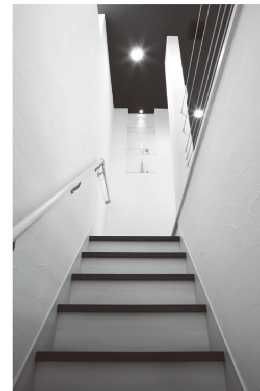
玄関ホールから続く階段。どこでも全部同じ温かな空間です。