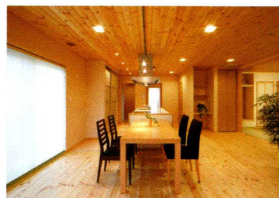
キッチン、ダイニング、リビングとが見事に調和したLDK。床、天井と無垢材を使用し、木の美しさとぬくもりに溢れている。