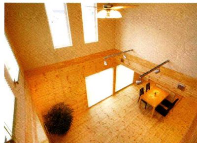
吹き抜けからLDKを俯瞰。多くの窓からはたくさんの光が射こみ明るい室内が実現。