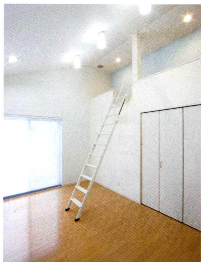
白を基調とした子供部屋。明るく清潔感あふれている。